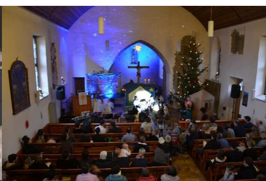
Impressionen vom Nikolausabend, Gottesdienst an Heiligabend, Sternsinger, Neujahrsempfang, Spendenübergabe CVJM, Mittagessen in der Winterkirche und Kofirmanden