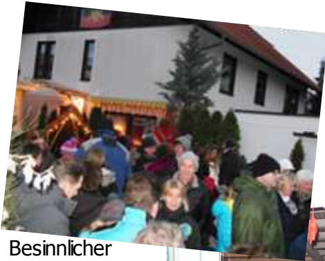
Besinnlicher Adventsweg am 14.12.2014